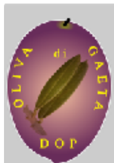
Il logo del Consorzio di Tutela e Valorizzazione dell'Oliva di Gaeta D.O.P.